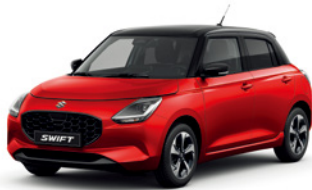
Vermelho Burning Pérola Metalizado / Preto Superior Pérola Metalizado