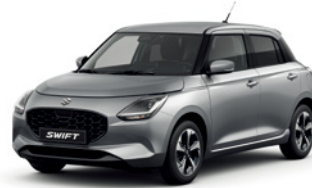
Prata Premium Metalizado