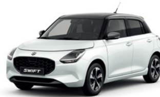
Branco Pérola Metalizado / Cinza Mineral Metalizado