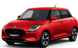
Vermelho Burning Pérola Metalizado