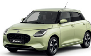
Amarelo Cool Metalizado