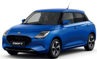
Azul Frontier Pérola Metalizado