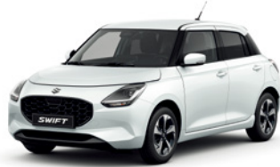
Branco Pérola Metalizado