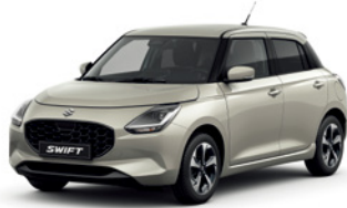
Marfim Pérola Metalizado