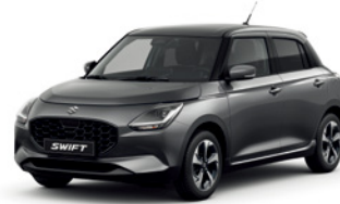
Cinza Mineral Metalizado