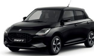
Preto Superior Pérola Metalizado