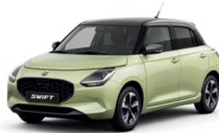
Amarelo Cool Metalizado / Cinza Mineral Metalizado