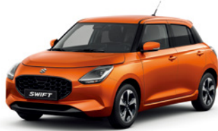
Laranja Flame Pérola Metalizado