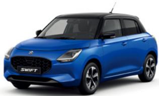
Azul Frontier Pérola Metalizado / Preto Superior Pérola Metalizado