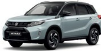
Cinza Azulado Metalizado / Preto Cósmico Pérola Metalizado