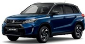
Azul Esfera Pérola / Preto Cósmico Pérola Metalizado