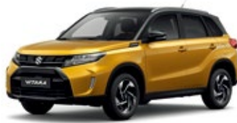
Solar Yellow Pérola Metalizado / Preto Cósmico Pérola Metalizado