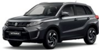
Cinza Escuro Titan Pérola Metalizado