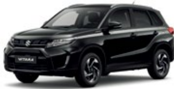
Preto Cósmico Pérola Metalizado