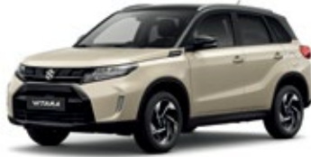
Marfim Savana Metalizado / Preto Cósmico Pérola Metalizado