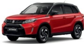
Vermelho Bright / Preto Cósmico Pérola Metalizado