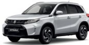
Prata Seda Metalizado